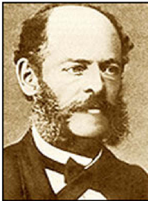
Изображение 1. Марселино де Саутуола

Владельцем земель, на которых располагалась Альтамира, был итальянский юрист и археолог-любитель Марселино де Саутуола. В 1875 году он провел ее первое исследование. Целью Саутуолы был поиск первобытного оружия, которое, как он предполагал, могло находиться в глубинах пещеры. Дочка Мария, которую однажды он взял с собой, обнаружила разноцветные наскальные изображения бизонов. Эти рисунки позволили дону Марселино де Саутуоле выдвинуть гипотезу, что наскальная живопись пещеры Альтамира является ничем иным, как следами неизвестной до сих пор жизнедеятельности древних людей.