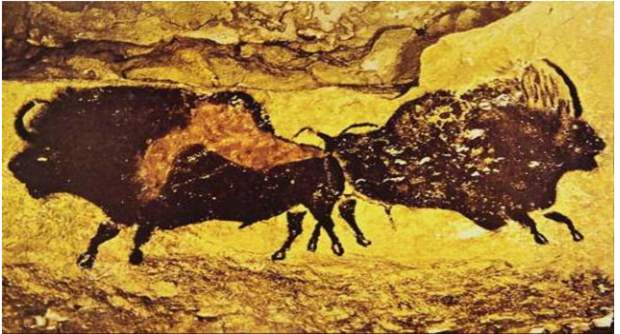
Изображение 9. Бизоны в пещере Ласко 2

В «зале быков» находится самая красочная композиция Ласко. Её кальцитные стены плохо подходили для гравировки, поэтому были украшены живописными изображениями внушительных размеров: некоторые из них достигают 5 м в длину. Два ряда зубров расположены друг напротив друга, два с одной стороны и три с другой. Двум зубрам с северной стены сопутствуют десяток лошадей и большое загадочное животное, на лбу которого изображено нечто вроде рога, за что он и получил название «единорог». На южной стене три больших зубра изображены рядом с тремя маленькими (красного цвета), шестью оленями и одним медведем в пещере, нарисованным на животе одного из зубров и потому плохо различимым. Считается, что шесть точек над головой одного из зубров представляют собой изображения скопления Плеяд в созвездии Тельца.