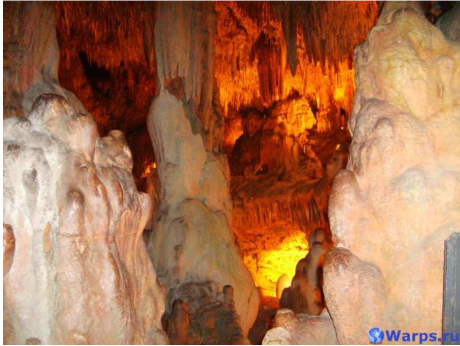
Изображение 5. Пещера Альтамира-2

В Альтамире идут исследования. На сегодняшний день удалось установить, что возраст рисунков в основном зале пещеры составляет около 13 130-14 820 лет, а другие изображения пещеры были изображены от 16 480 до 14 650 лет назад. Художники Педро Саура и Матильда Мускис считают, что вначале древние мастера сделали гравировку свода пещеры и лишь потом изобразили фигуры в цвете. А первыми древние люди изобразили красных лошадей, а потом уже бизонов. Самыми последними были изображены некоторые гравировки и росписи.