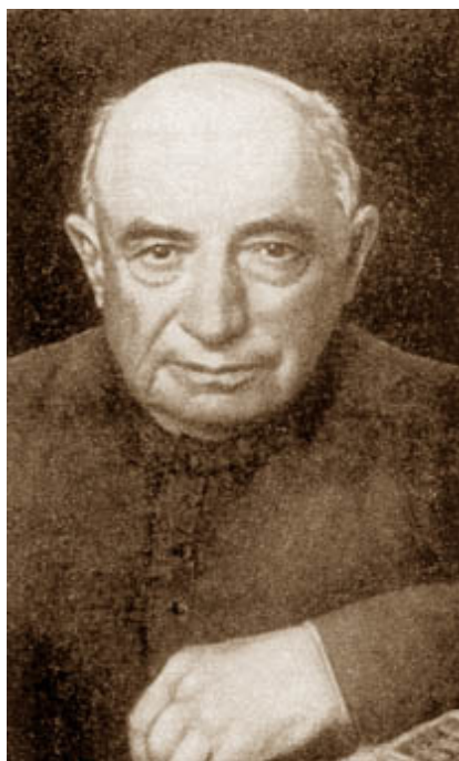
Изображение 8. Анри Брейль