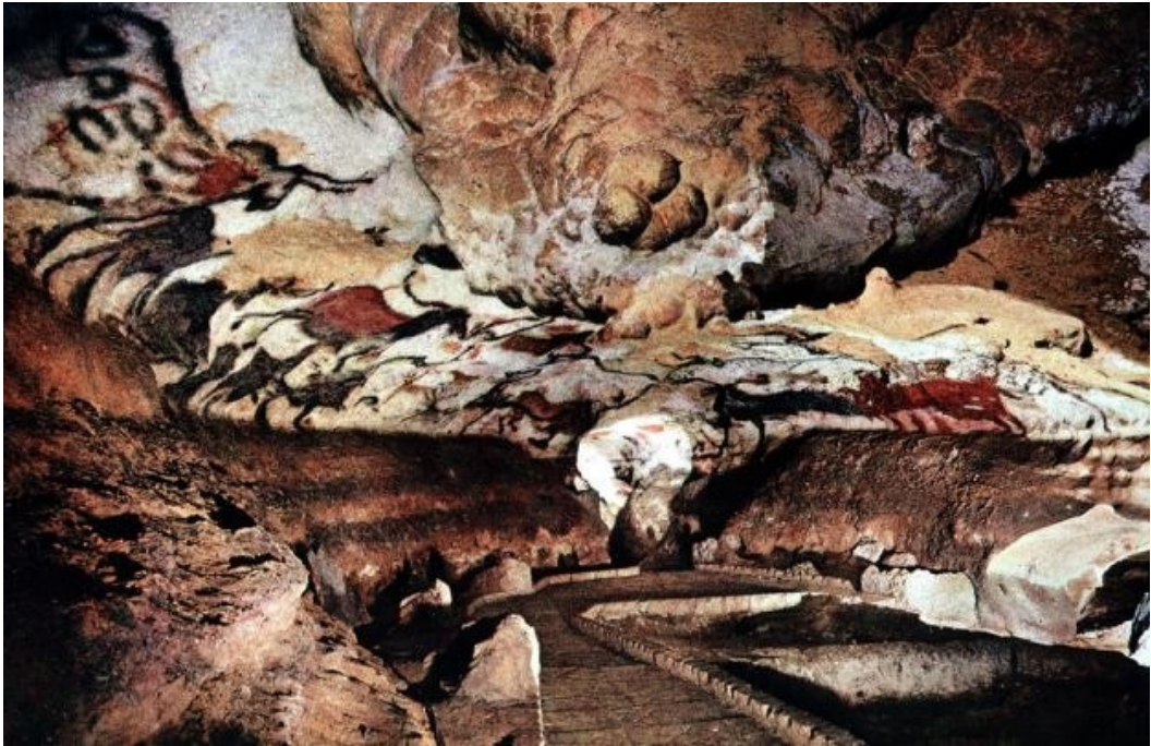
Изображение 7. Зал пещеры Ласко 1

Пещера находится в историческом регионе Франции Перигоре на территории коммуны Монтиньяк, примерно в 40 км к юго-востоку от города Перигё. Она расположена на левом берегу реки Везер в известняковом холме. В отличие от многих других пещер региона, Ласко – относительно «сухая» пещера. Слой непроницаемого мрамора ограждает её от проникновения воды, препятствуя образованию кальцитовых отложений.