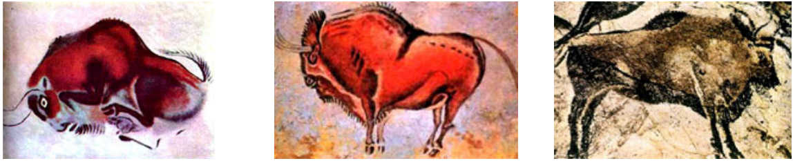
Изображение 3. Бизоны в пещере Альтамира

Первобытные художники с удивительной точностью сумели передать облик и повадки каждого зверя: животные то отдыхают, лениво вытянувшись во всю длину, то вот-вот ринутся в атаку, подобрвав под себя ноги и выставив вперёд рога. Они как живые.