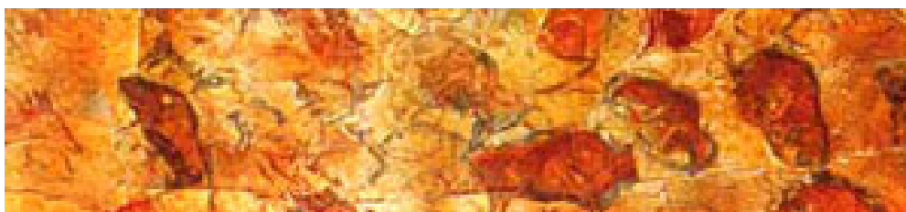
Изображение 2. Потолок пещеры Альтамира

Пещеру можно разделить на 3 «зала». В первом «зале» находится знаменитый потолок Альтамира, заполненный росписями. Рисунки нанесены углем, охрой, гематитом и другими естественными природными красителями, смешанными с водой или животным жиром.