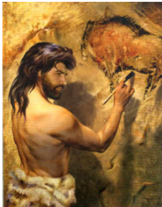
Изображение 4. Древний художник

Почти все животные изображены в натуральную величину, кое-где бизоны достигают 2,5 метров. Естественные рельефные выпуклости на скальной поверхности придают рисункам объём. Мастер с помощью резца оживил эти выпуклости, выгравировав силуэты свирепых бизонов и стройных оленей. Так, в Альтамире зародилась гравировка – нанесение краски на камень, металл путём резания.